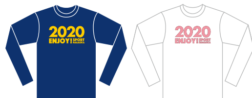
ネイビー ホワイト