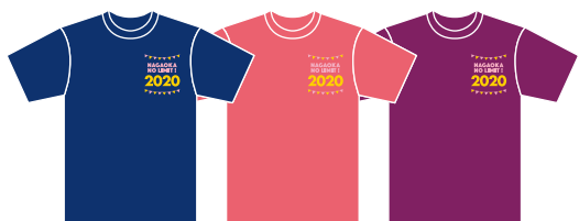
ネイビー ミックスレッド パープル