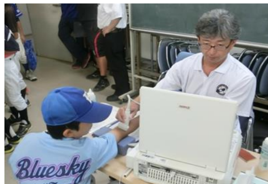
スポーツ医科学サポート機構ドクターによる 「野球肘検診」