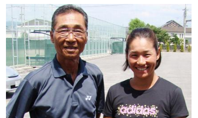
▲ 小浦猛志公式ホームページより

【事務局】 (公財)長岡市スポーツ協会 担当:室賀、加藤 電話 0258-34-2130 SCN長岡ホームページ http://www.n-spokyo.or.jp/sportscoacher/